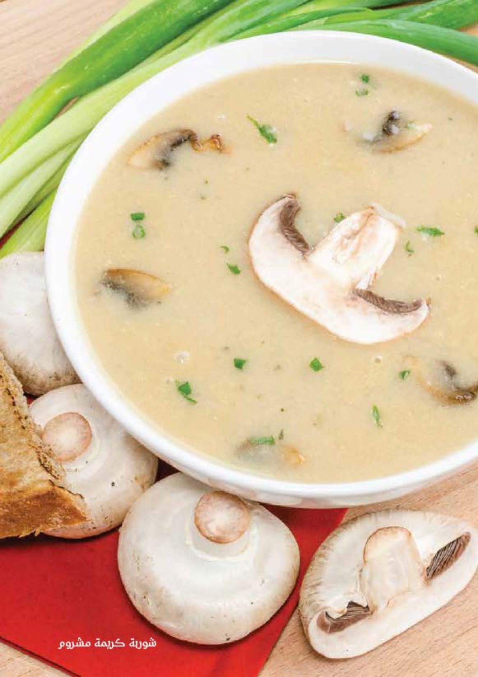
شوربة كريمة مشروم