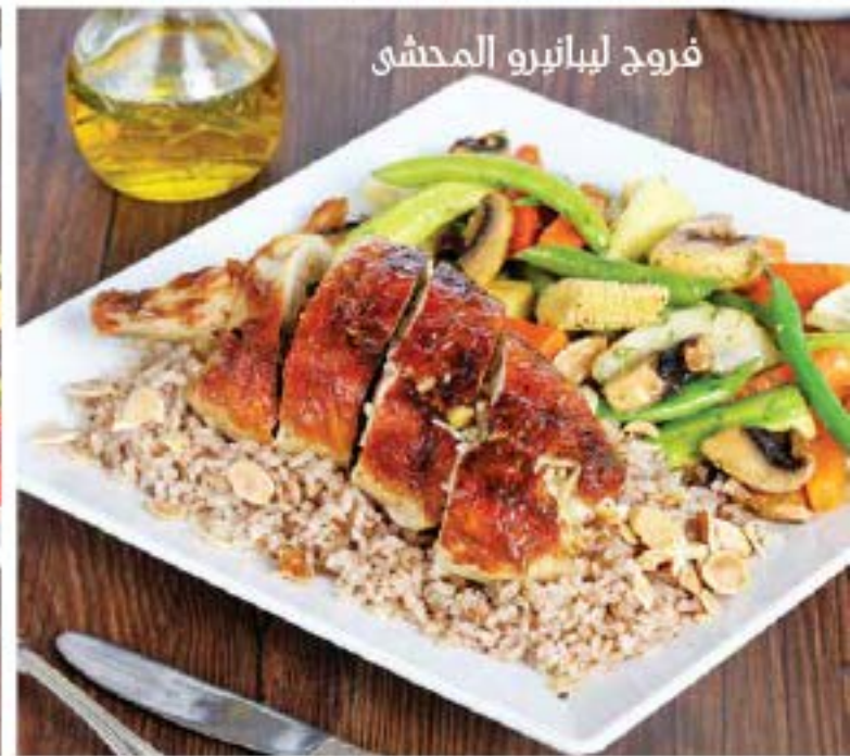
فروج لبانيرو المحشى