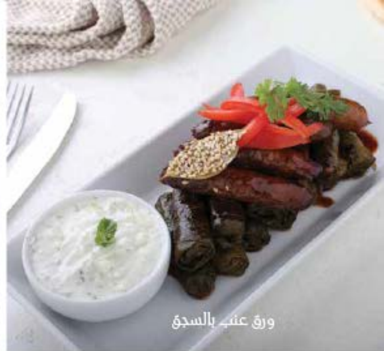
ورق عنب بالسجق