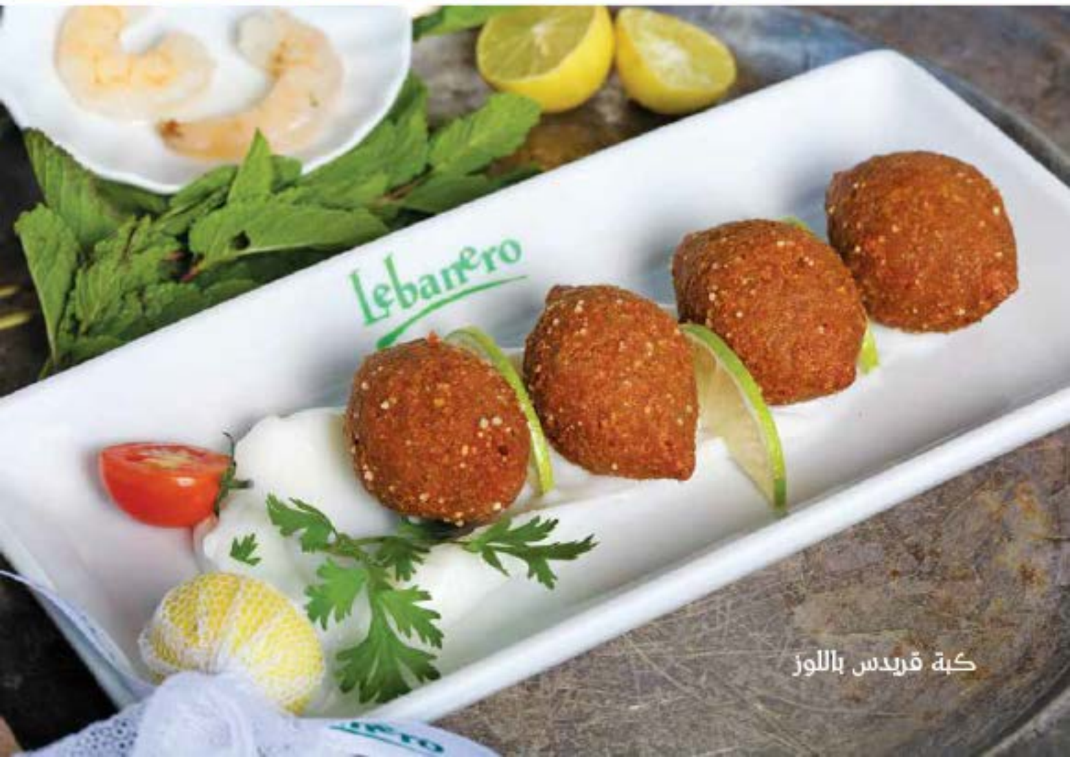
كبة قريدهس باللوز