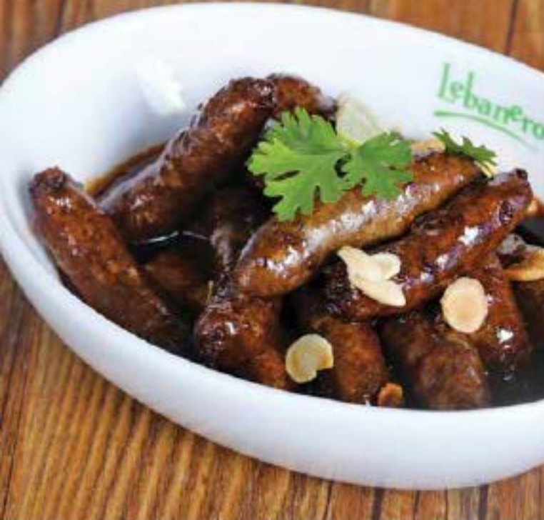
نقانق بدهس الرمان والبطاطا