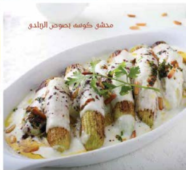
محمشي كوسه بصوص الرابدي