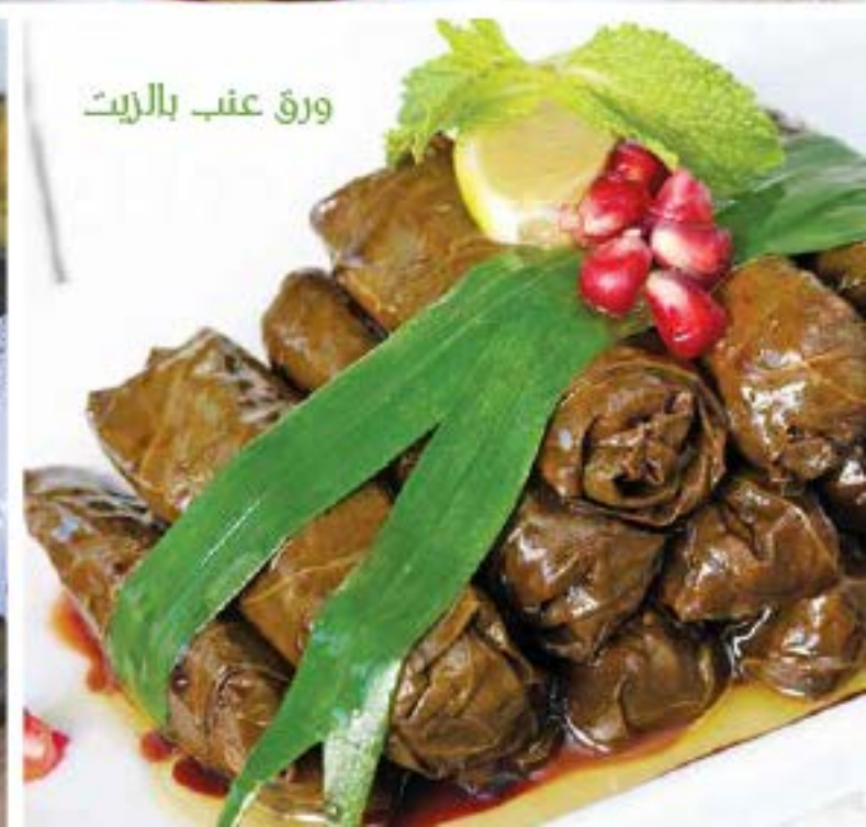
ورق عنب بالزيت