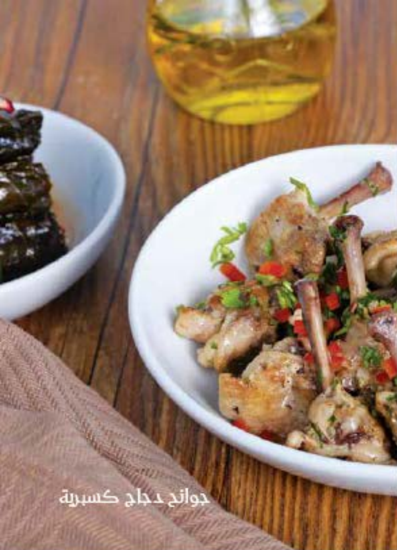
جوانح دجاج كسبرية