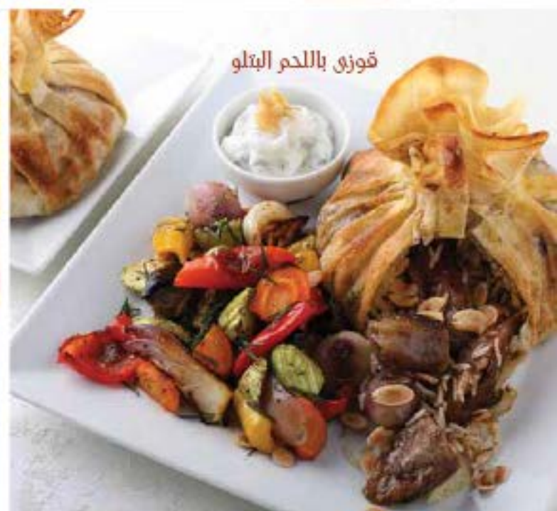
قوزي باللحم البتلو