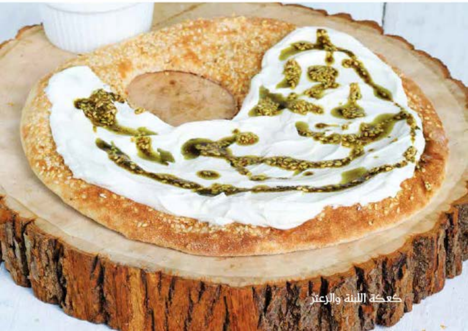
كعكة اللبنة والزعتر