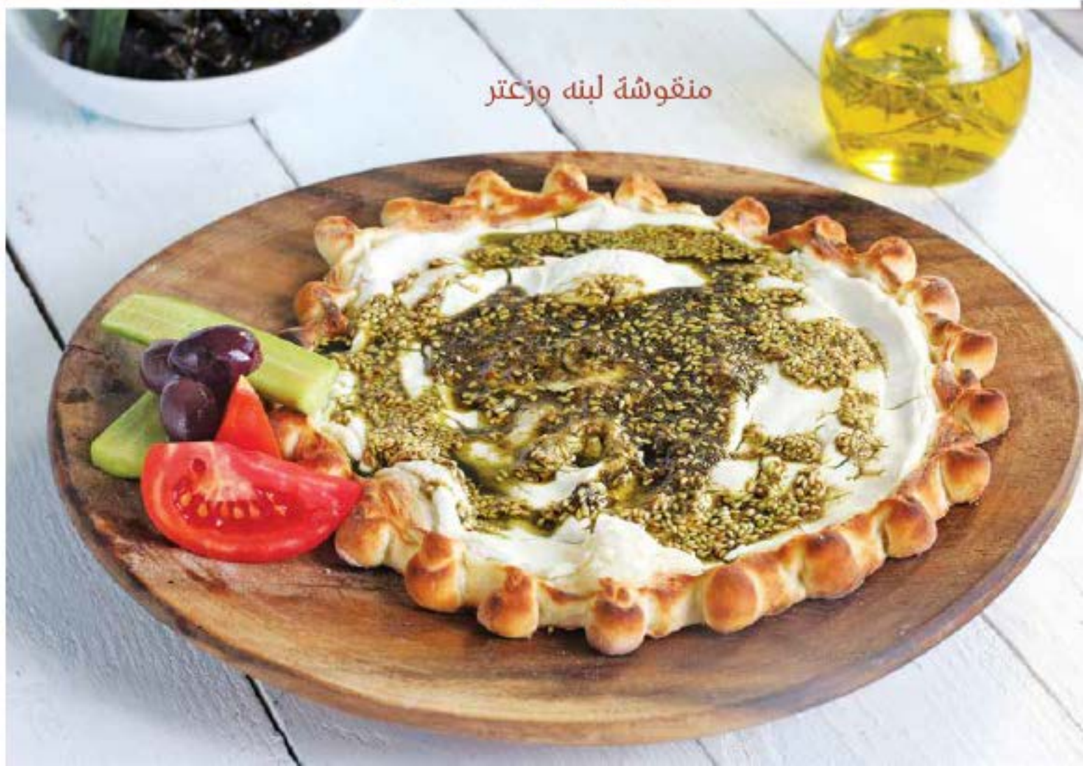
منقوشة لبنه وزعتر