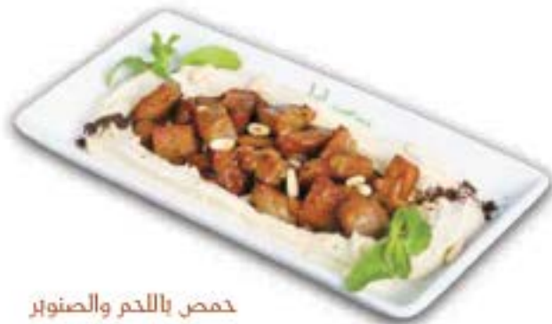
حمص باللحم والصنوبر