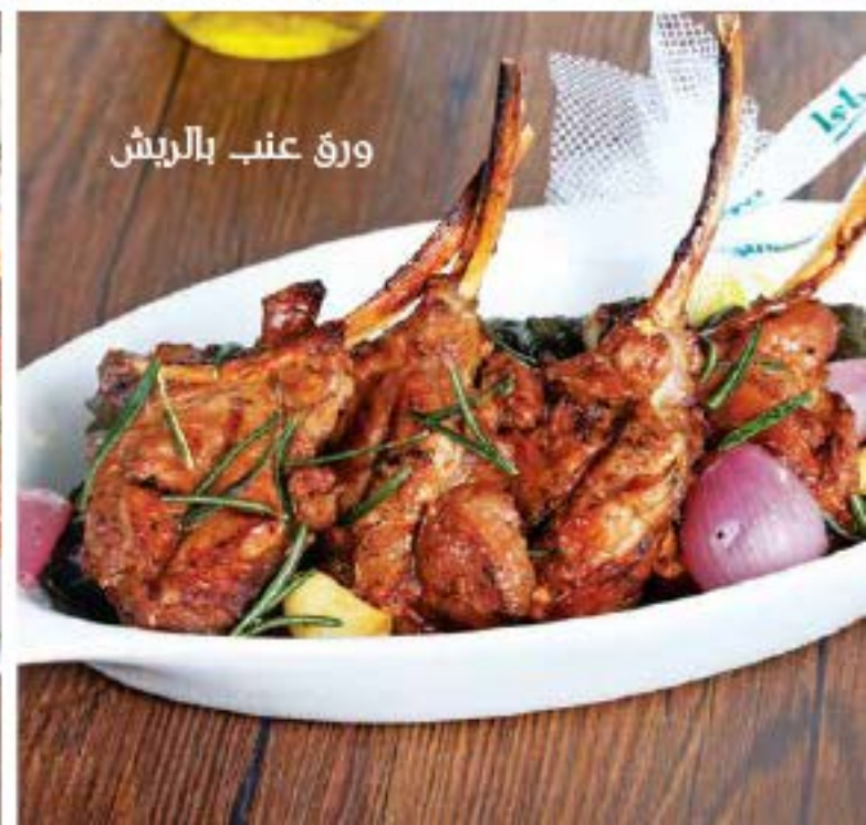
ورق عنب بالريش