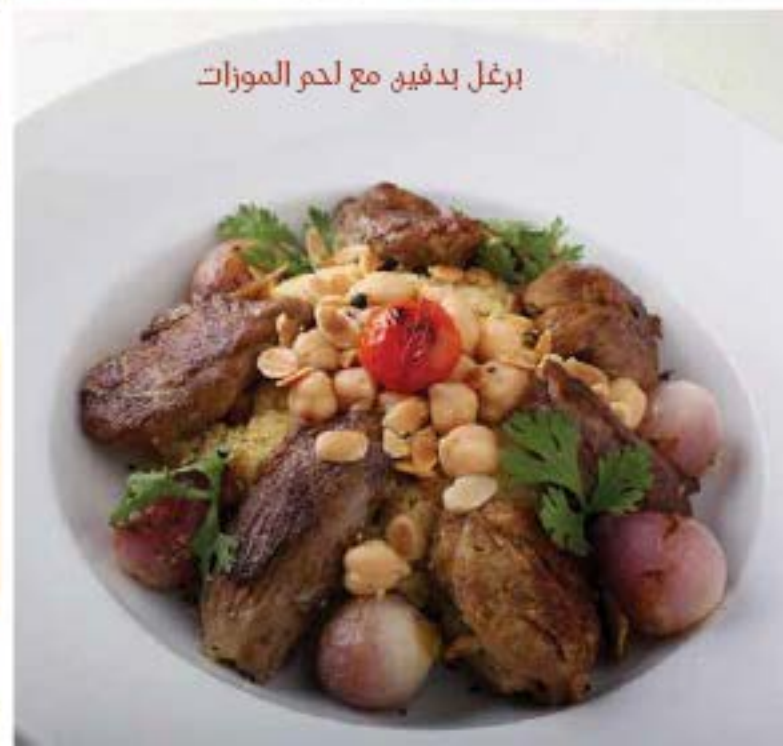
برغل بدفيق مع لحم الموزات