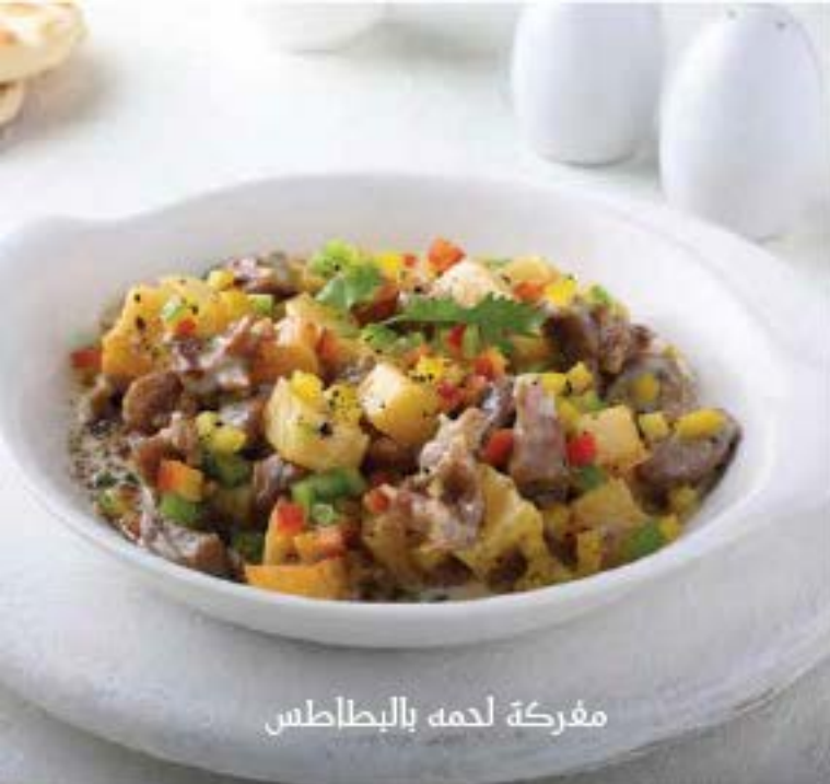
مفركة لحمه بالبطاطس