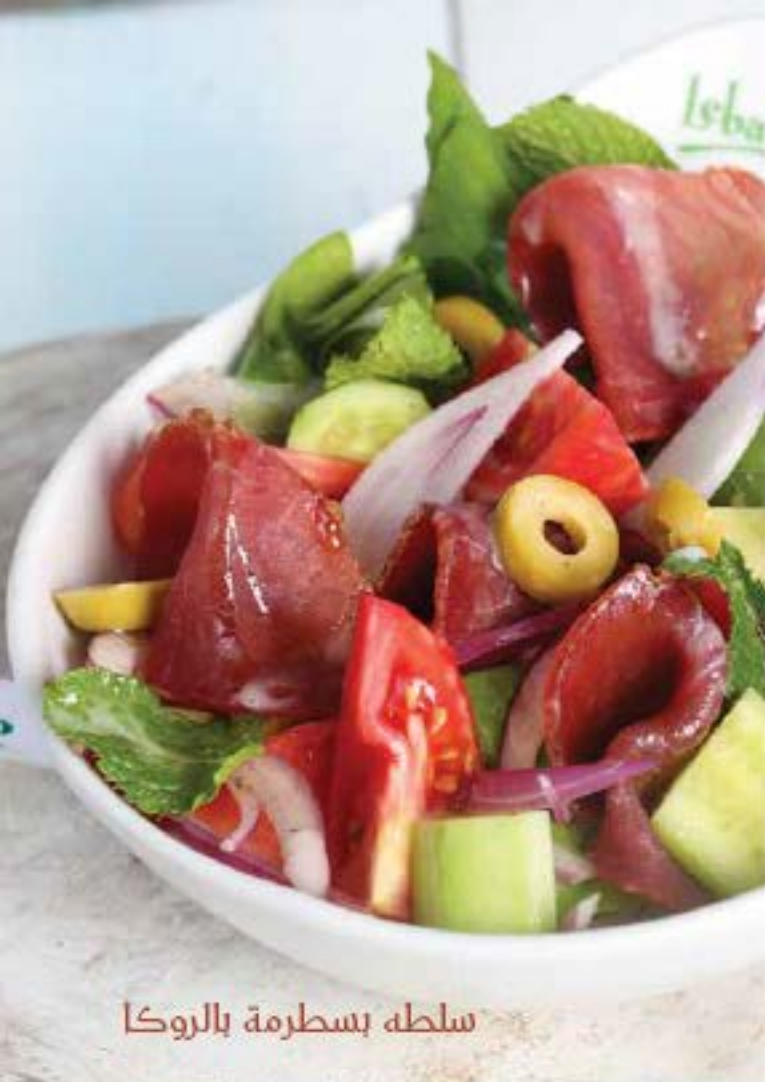
سلطة بسطرمة بالروكا