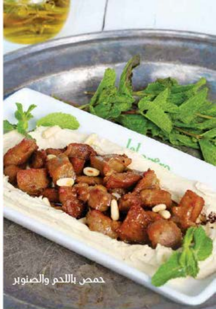
حمص باللحم والصنوبر