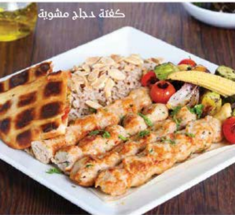
كفتة دجاج مشوية