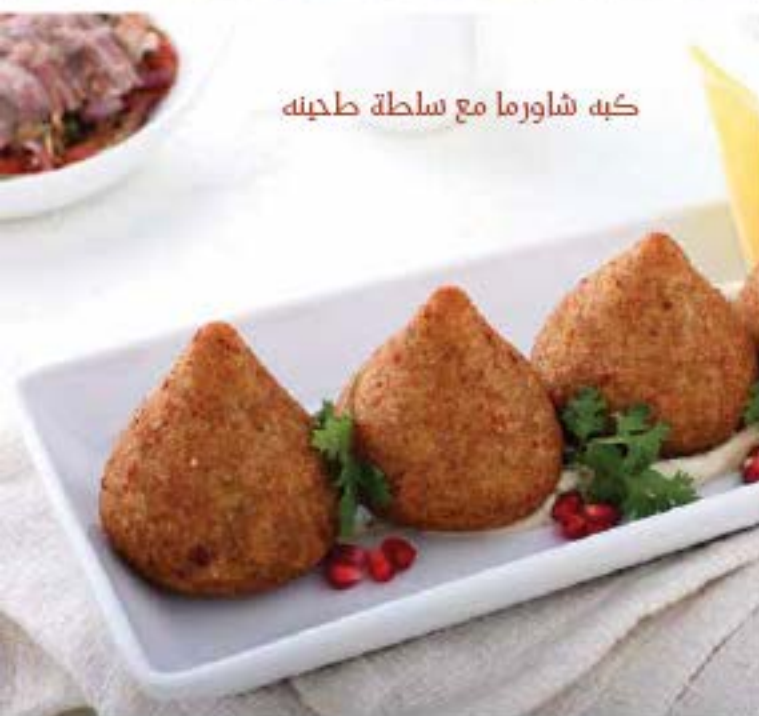
كبه شاورما مع سلطة طحينه