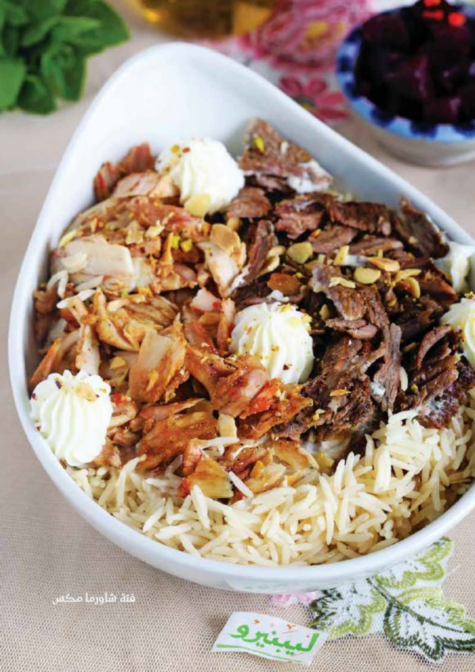
فتة شاورما مكس