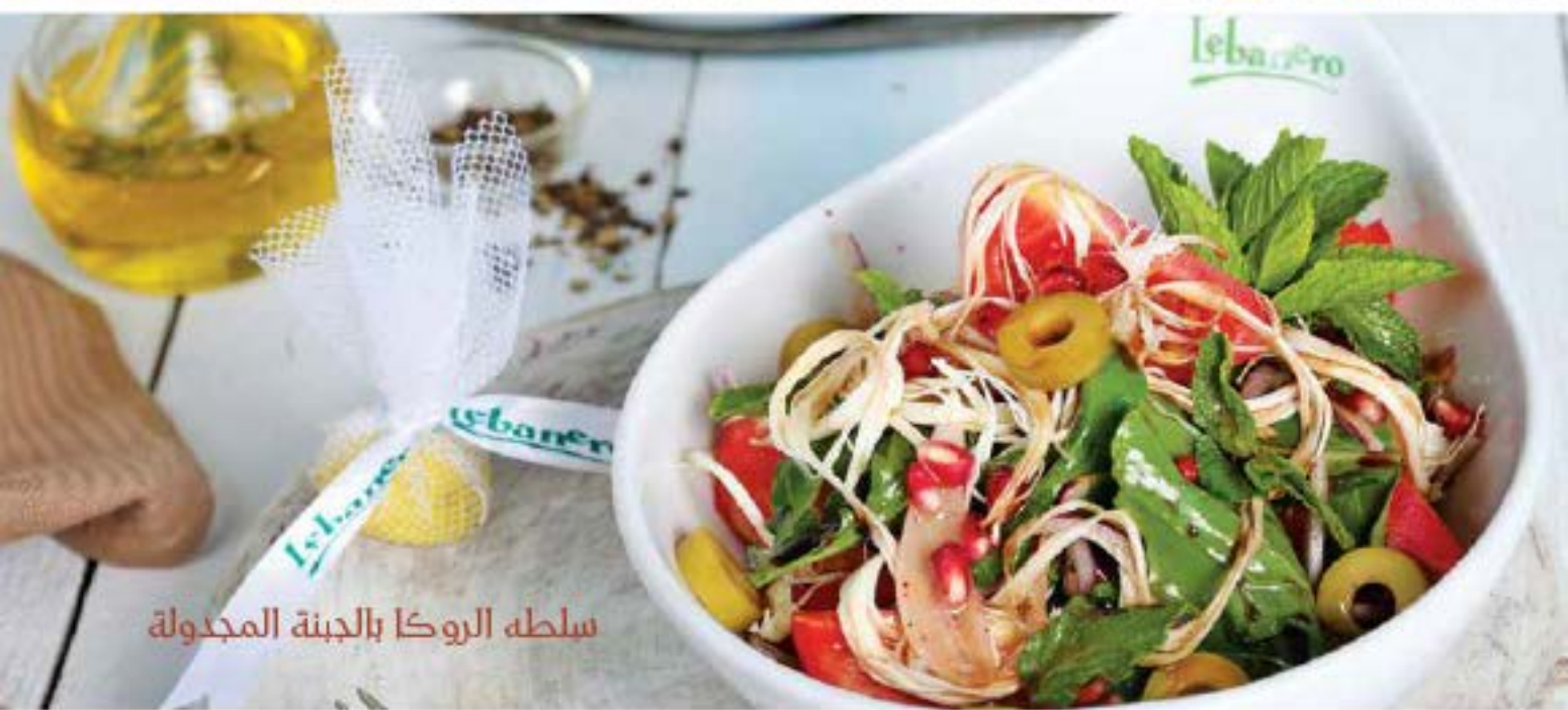
سلطة الروكا بالجبنه المجدولة